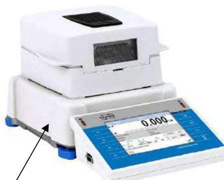
Место нанесения знака поверки