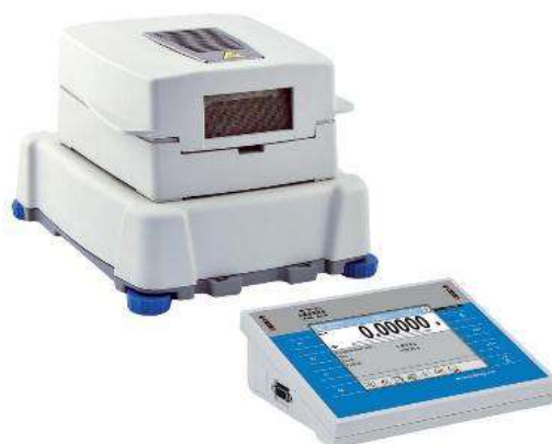
Рисунок 2 – Общий вид анализатора влажности с беспроводным дисплеем (3Y.B)