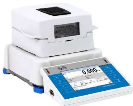
Рисунок 1 – Общий вид анализатора влажности с цветным сенсорным дисплеем 5,7" (3Y)

Общий вид анализаторов влажности представлен на рисунках 1, 2, 3, 4.