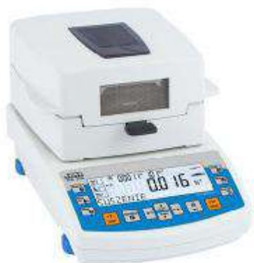
Рисунок 3 – Общий вид анализатора влажности со стандартным LCD дисплеем (R2)