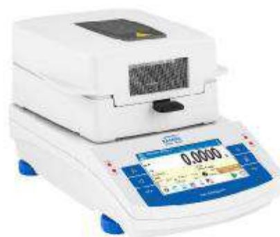
Рисунок 4 – Общий вид анализатора влажности с цветным сенсорным дисплеем 5" (X2)

Для защиты анализатора от несанкционированного доступа, который может привести к искажению результатов измерений, корпус анализатора пломбируется контрольной этикеткой изготовителя.